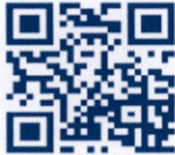
แนวทางดำเนินงาน