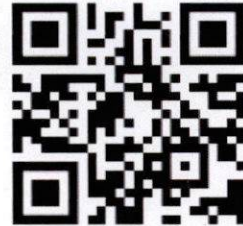
ปฏิทินดำเนินงาน